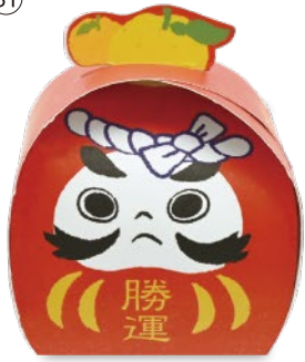
だるま (赤) ゆずの香り