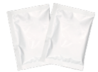
パウダーバス 2包入り

冷え症、肩のこり、疲労回復に効果的な薬用入浴剤です。裏面にはおすすめの入浴法を記載しています。