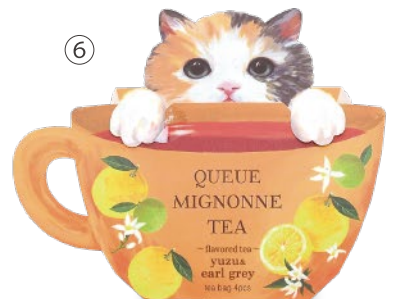
ゆず&アールグレイ 【賞味期限 2027年6月】