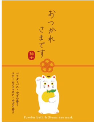
おつかれさまです