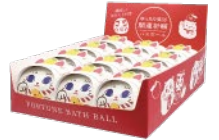
ディスプレイ ボックス付き