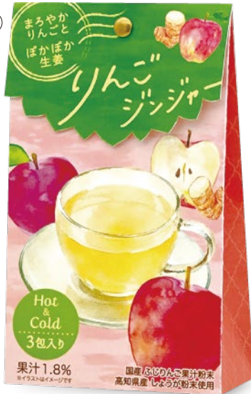
りんごジンジャー 国産ふじりんご果汁使用