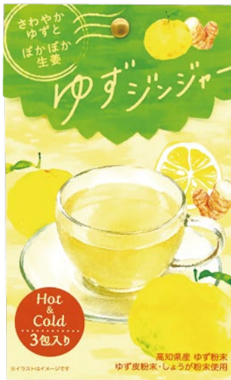
ゆずジンジャー 高知県産ゆず粉末・ゆず皮粉末使用