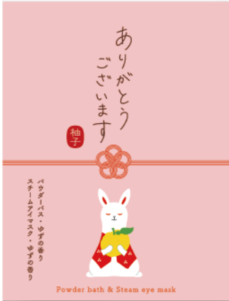
ありがとうございます