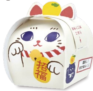
招き猫 (白) ゆずの香り