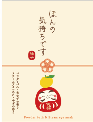
ほんの気持ちです