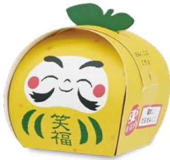
だるま (黄) ゆずの香り