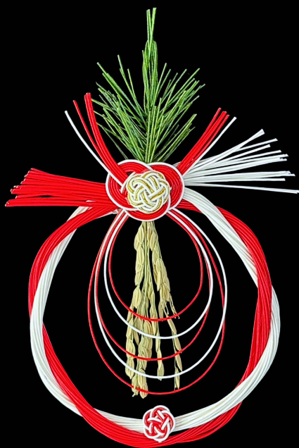
27-G 品番 : 5602006101 上代 : 1,900 (税抜) size : W12×D2×H18cm