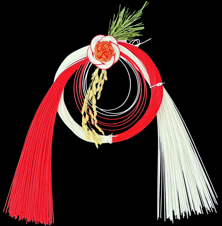
27-D 品番 : 5602005801 上代 : 2,900 (税抜) size : W27×D3×H27cm