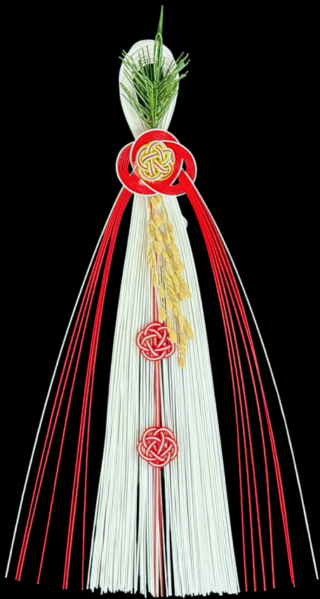
27-A 品番 : 5602005501 上代 : 2,900 (税抜) size : W12×D2.5×H35cm