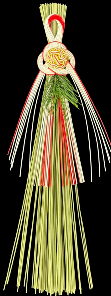
27-N 品番：5602006801 上代：2,900（税抜） size：W11×D3×H33cm