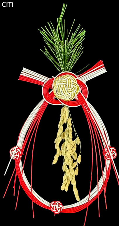
27-J 品番 : 5602006401 上代 : 1,900 (税抜) size : W11×D2×H21cm