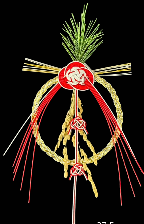
27-F 品番 : 5602006001 上代 : 1,900 (税抜) size : W12×D1.6×H23cm