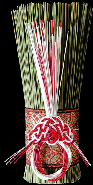
デスタン 品番：5602001003 上代：4,500（税抜） size：W10×D8×H24cm