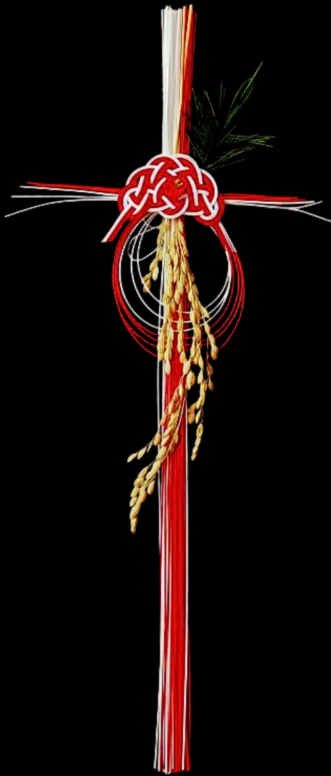
ライン-d 品番：5602001601 上代：2,300（税抜） size：W17×D3×H42cm