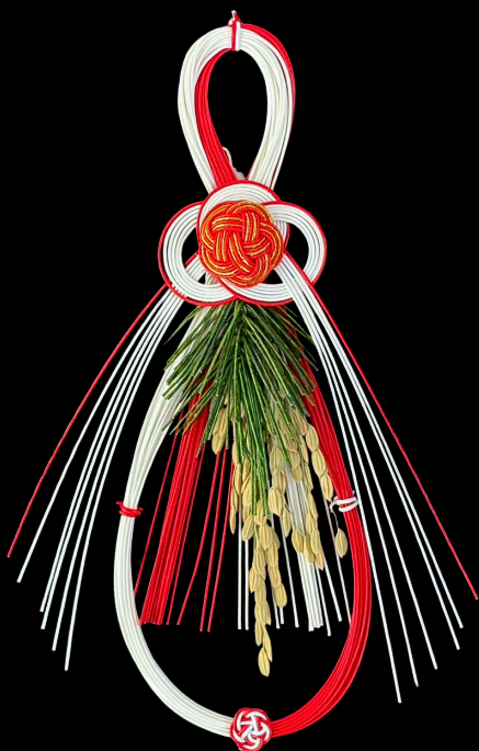
27-K 品番 : 5602006501 上代 : 1,900 (税抜) size : W12×D2×H21cm