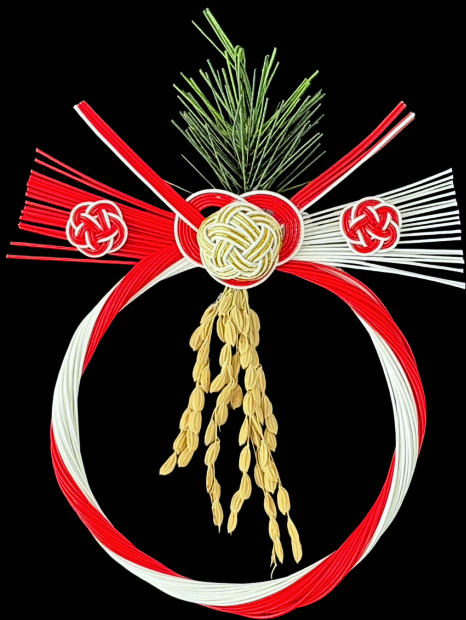
27-E 品番 : 5602005901 上代 : 1,900 (税抜) size : W14×D2×H18cm