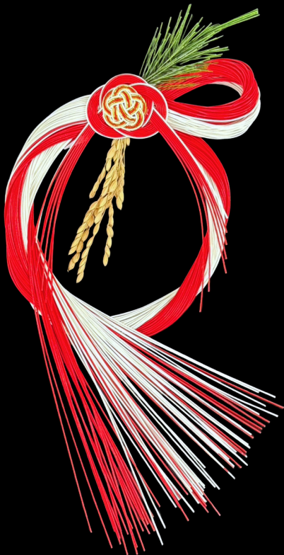
27-C 品番 : 5602005701 上代 : 2,900 (税抜) size : W18×D3×H28cm