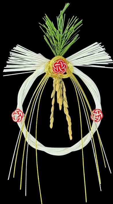
27-H 品番 : 5602006201 上代 : 1,900 (税抜) size : W12×D2×H21cm