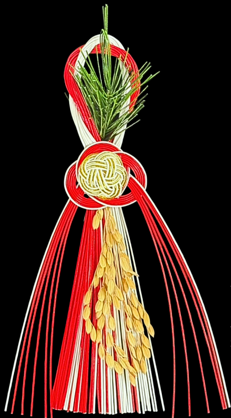
27-I 品番 : 5602006301 上代 : 1,900 (税抜) size : W11×D2×H21cm