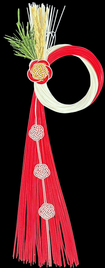
27-B 品番 : 5602005602 上代 : 2,900 (税抜) size : W14×D3×H38cm