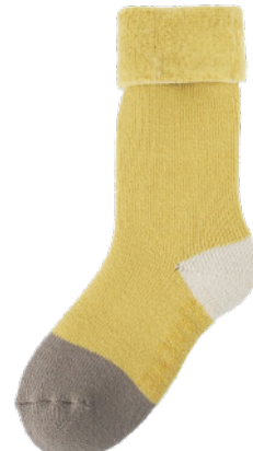
5709006403 イエロー size23~25cm