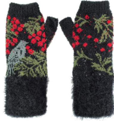
5714001602 バード ブラック