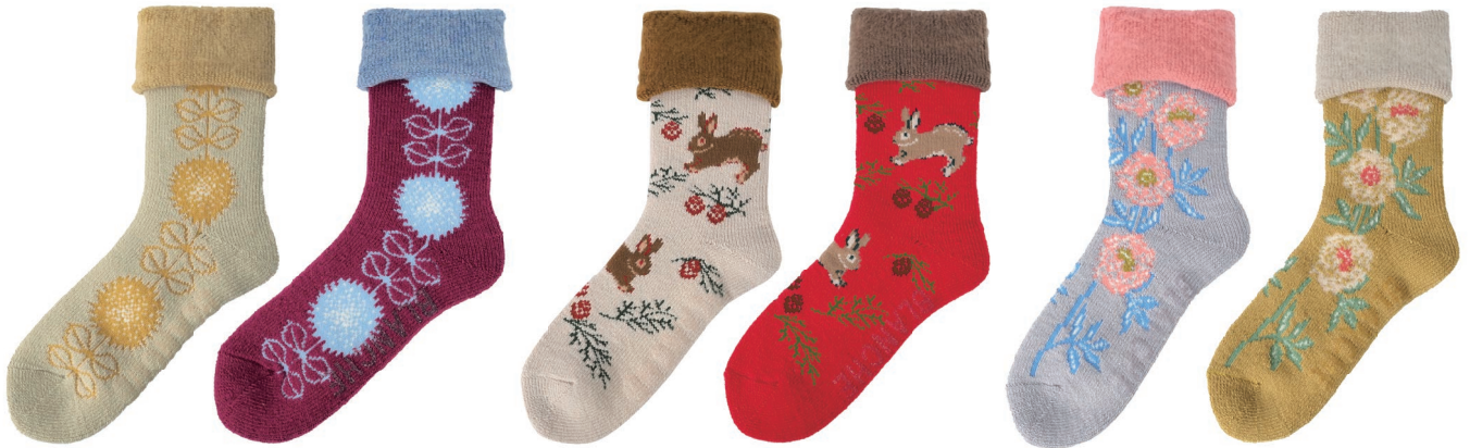
5709006701 フルール ライトイエロー

内側は、思わず触れたいくなるほどふわふわとした濃密な起毛仕立て。 ふくらはぎまでやさしく包み込む、やわらかな肌触りのルームソックスです。