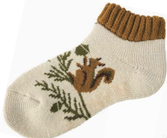
5709006605 フォレスト アイボリー