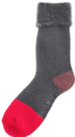
5709006501 チャコール size25~28cm