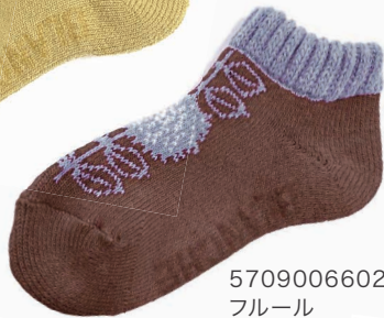
5709006602 フルール ブラウン