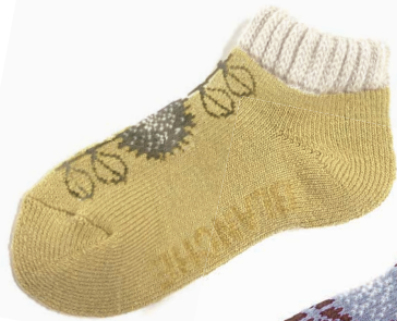
5709006601 フルール イエロー

内側は、思わず触れたいくなるほどふわふわとした濃密な起毛仕立て。 ゆったり履けるカバータイプなので、お手持ちの靴下との重ね履きもスムーズです。