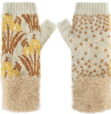
5714001603 アイリス アイボリー