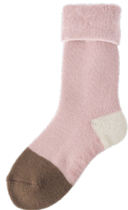
5709006404 ピンク size23~25cm