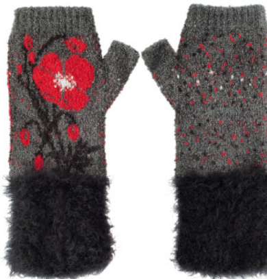
5714001605 アネモネ チャコール