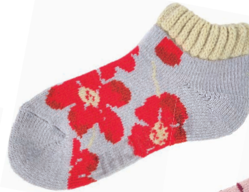
5709006603 ルヴァン ライトグレー