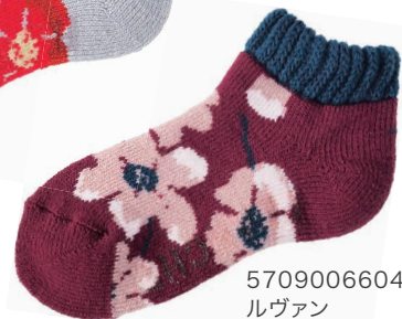
5709006604 ルヴァン ボルドー