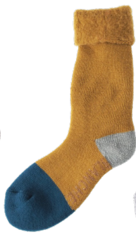
5709006502 キャメル size25~28cm