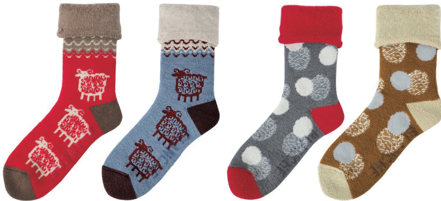
5709006707 シープ レッド