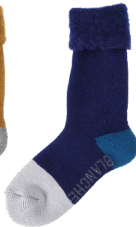
5709006503 ネイビー size25~28cm