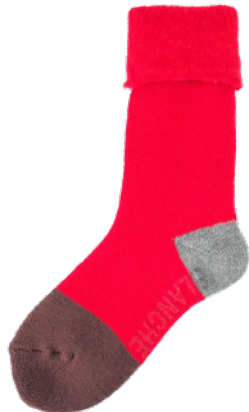
5709006402 レッド size23~25cm