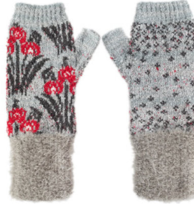
5714001604 アイリス グレー