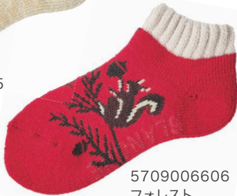
5709006606 フォレスト レッド