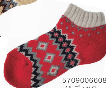
5709006608 ノルディック レッド