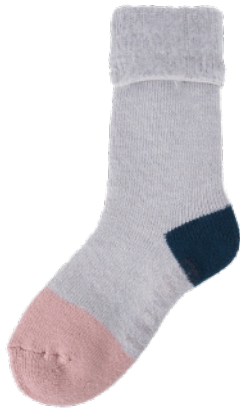
5709006401 ライトグレー size23~25cm

内側は、思わず触れたいくなるほどふわふわとした濃密な起毛仕立て。 ふくらはぎまでやさしく包み込む、やわらかな肌触りのルームソックスです。