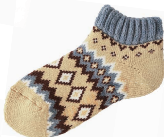
5709006607 ノルディック ライトイエロー