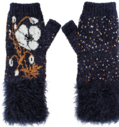
5714001606 アネモネ ネイビー

遠赤外線アームウォーマー 本体価格 ¥3,300 (税込¥3,630) lot 2