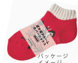
パッケージ イメージ