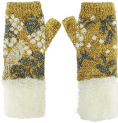
5714001601 バード イエロー